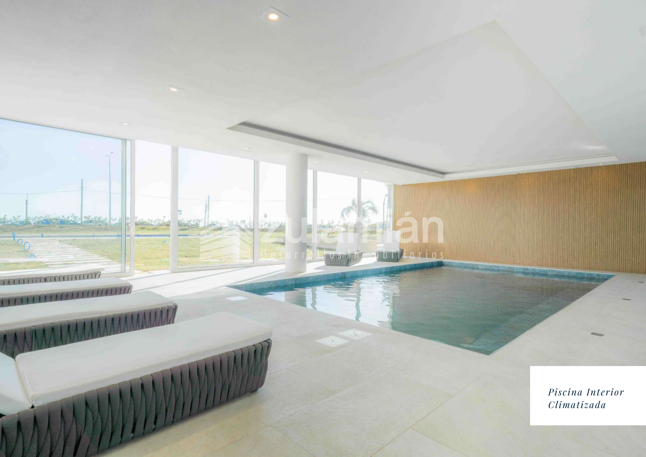
Piscina Interior Climatizada